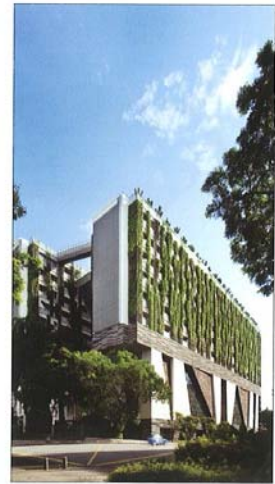
Zmagovalna stavba kategorije izobraževanje: School of the Arts, Singapur; arhitektura: WOHA, Singapur