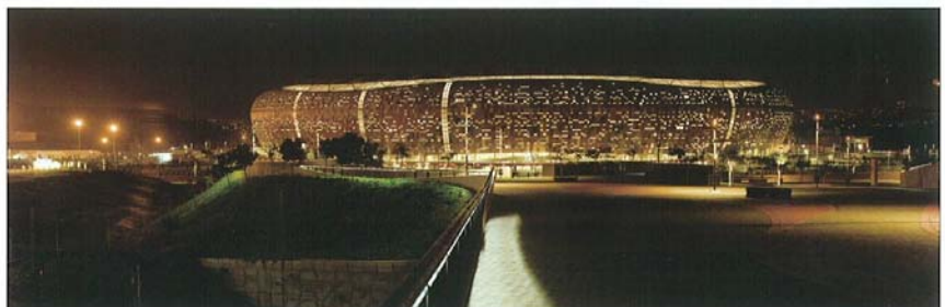
Zmagovalna stavba kategorije šport: narodni štadion Soccer City, Johannesburg, Južna Afrika; arhitektura: Boogertman+Partners, Južna Afrika v sodelovanju z Populous, Velika Britanija