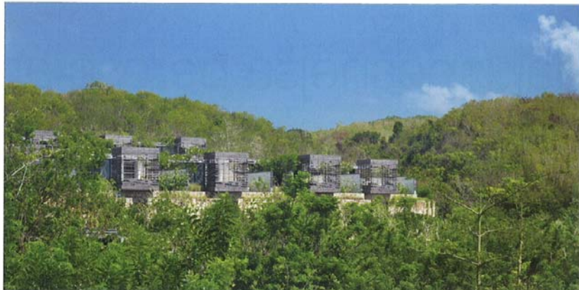
Zmagovalna stavba kategorije počitnice: Alila Villas Uluwatu, Bali, Indonezija; arhitektura: WOHA, Singapur

tenih je bil Studio Kalamar za prezentacijo izbran v obeh kategorijah (n.pr. z ambiciozno sodobno, a hkrati tradicionalno vinsko kletjo iz Prekmurja), medtem ko je n.pr. sicer zanimiv in celovit projekt ureditve trga in hotela v Postojni ostal le na panojih.