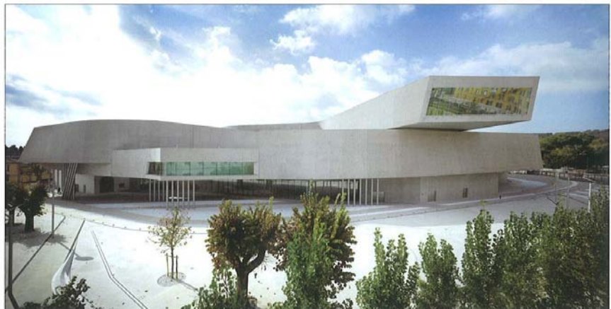
Najboljša stavba sveta: narodni muzej umetnosti 21. stoletja MAXXI, Rim, Italija; arhitektura: Zaha Hadid Architects, Velika Britanija

Struktura festivala je po svoje zanimiva, nudi mešanico raznolikih dogodkov, ki segajo od velike razstave prijavljenih projektov preko predavanj in sponzorskih dogodkov do živih prezentacij. Prav slednje so tiste, ki festival prepoznavno ločijo od siceršnjih mednarodnih arhitekturnih konferenc in simpozijev, ki so zasnovani predvsem kot niz »ex chatedra« predavanj. Na WAF prav »tekmovalne« predstavitve po posameznih kategorijah, ki jih je na festivalu obilo (čeprav nekaterih arhitektur pač ne moreš umestiti v predalčke klasičnih tem), tvorijo živo jedro dogajanja. Za vsak izbrani (»shortlisted«) projekt je na razpolago dvajset minut časa, znotraj katerih morata avtor ali avtorski tim predstaviti svojo rešitev, tematska komisija pa ga