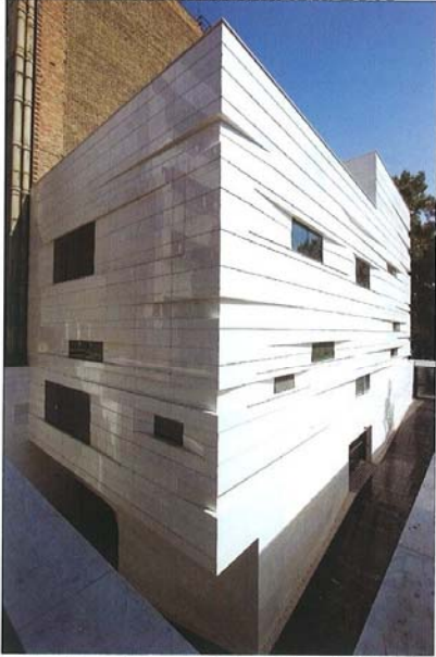
Zmagovalna stavba kategorije pisarniških stavb: Vali Asr Commercial Office Building, Iran; arhitektura: Kelvan, Iran