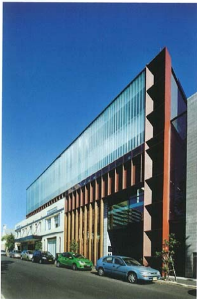
Zmagovalna stavba kategorije zdravje: Brain and Mind Research Institute - Youth Mental Health Building, Avstralija; arhitektura: BVN Architecture, Avstralija