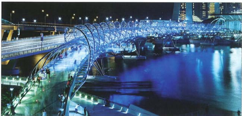
Zmagovalna stavba kategorije transport: The Helix Bridge, Singapur; arhitektura: Cox Rayner Architects, Avstralija + Architects 61 Pte, Singapur

Prikazani projekti so po izboru uredništva, sicer pa si lahko vse ogledate na www.worldarchitecturefestival.com